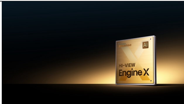
Abb. 1: Hi-View Engine X

Hisense ist mit seinem neuen TV-Chip ein weiterer Innovationssprung gelungen.